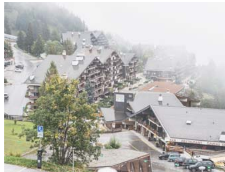
L'avenir de la station est pensé par tous.