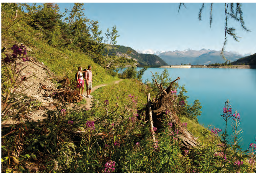
Avoir un magnifique paysage ne suffit plus. C'est l'expérience vécue par le touriste qui crée de la valeur.

Les acteurs du tourisme doivent donc bâtir ensemble. Et pour bâtir, il faut